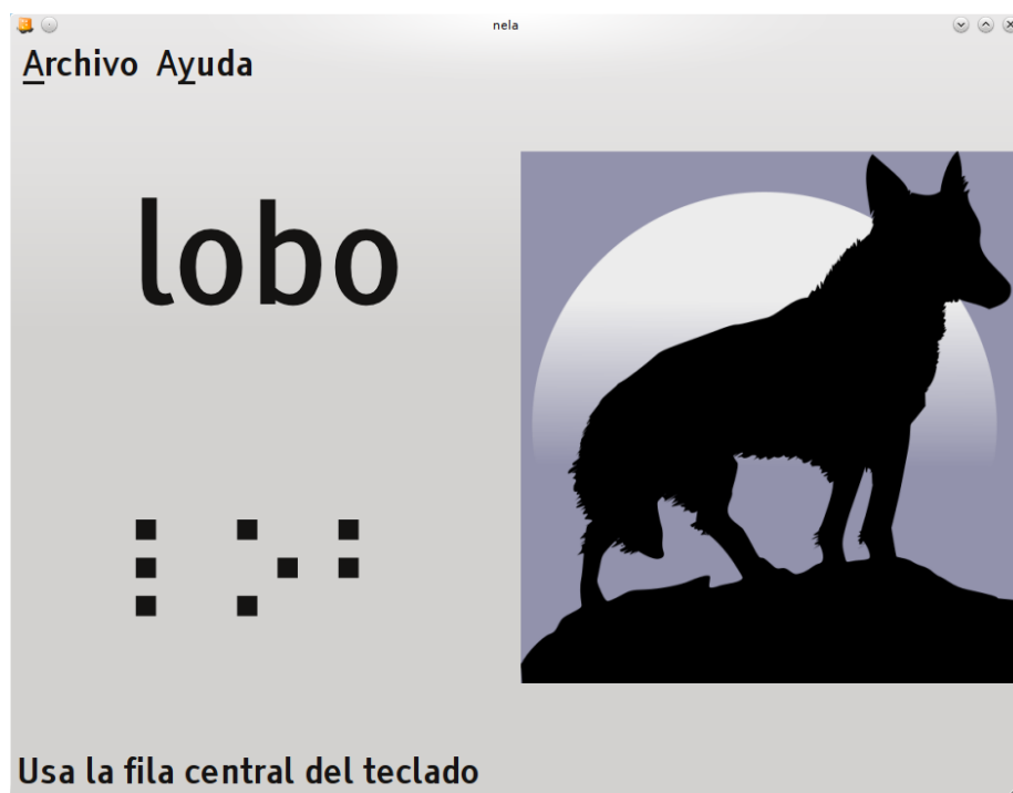
Figura 3: Interfaz gráfica de Nela.

Para escribir una letra en una máquina Perkins, se pulsán simultáneamente las teclas correspondientes a los puntos de dicha letra.